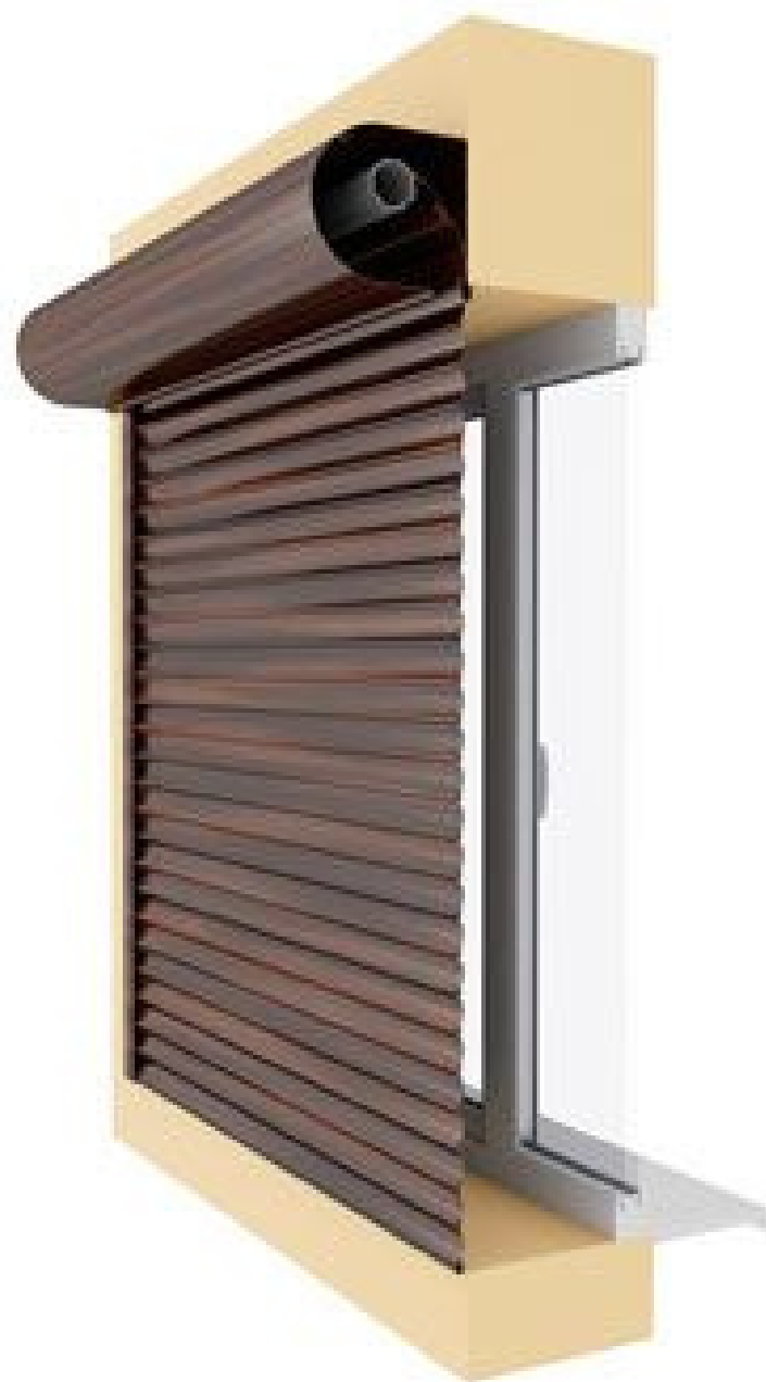
2 variants Uzstādīšana virs ailes