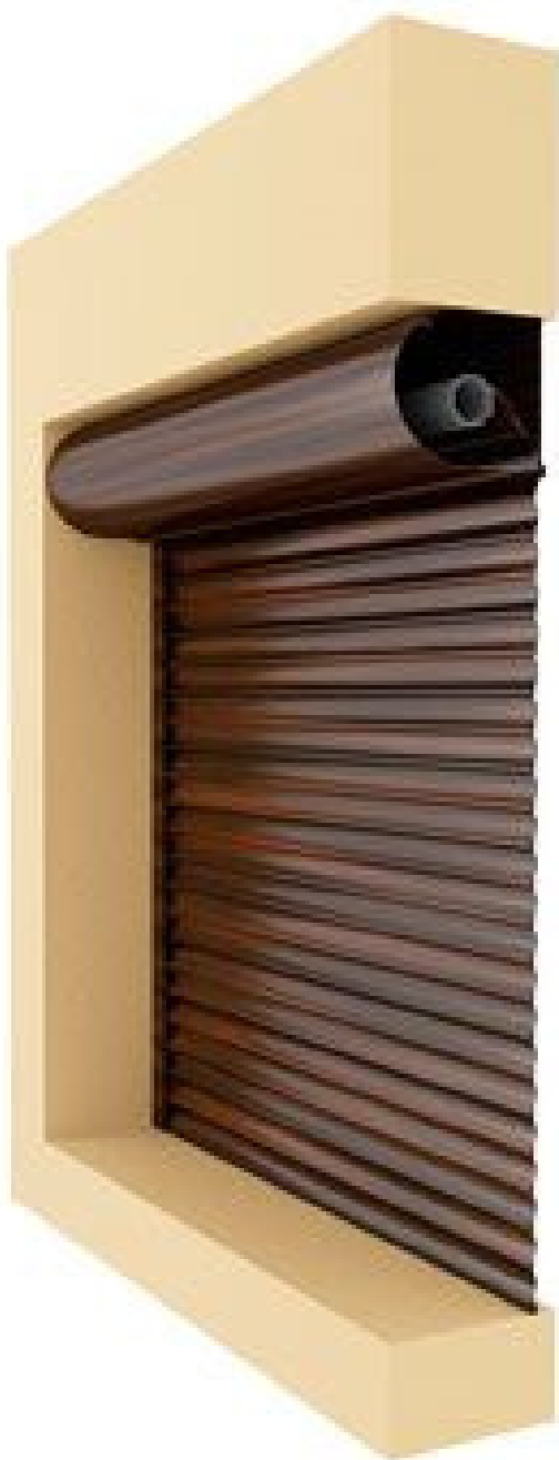
1 variants Uzstādīšana ailē